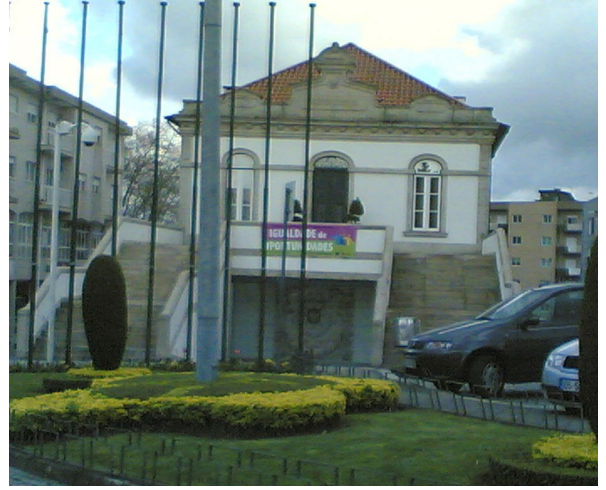
Andor grande nas festas da Nossa Senhora da Aparecida e edifício dos paços de Concelho